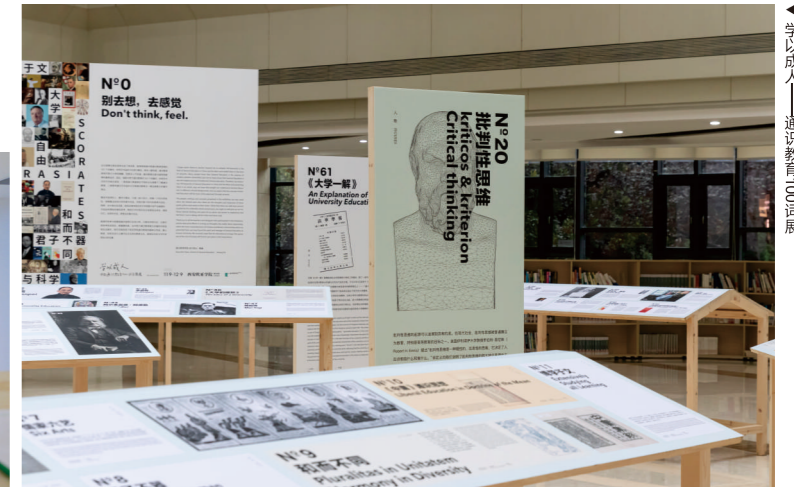
学以成人——通识教育100课展