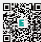
西安欧亚学院招生办 官方微信