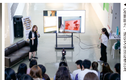
GE影响力·通识文化系列活动季沙龙