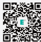
西安欧亚学院 官方微信