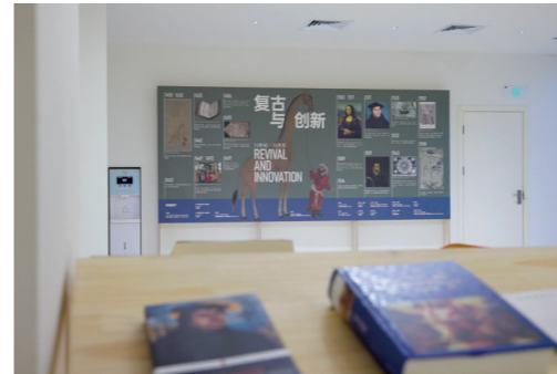
循时之径·通识教育100课展

当你的潜能被充分地激发， 你会惊喜地发现自己的 批判性思维与创新思维、表达与沟通能力、 团队合作以及分析和综合信息的能力飞速成长， 投入专业学习、竞赛、社团活动或求职时，也更加游刃有余。