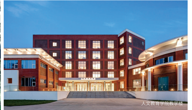
人文教育学院教学楼